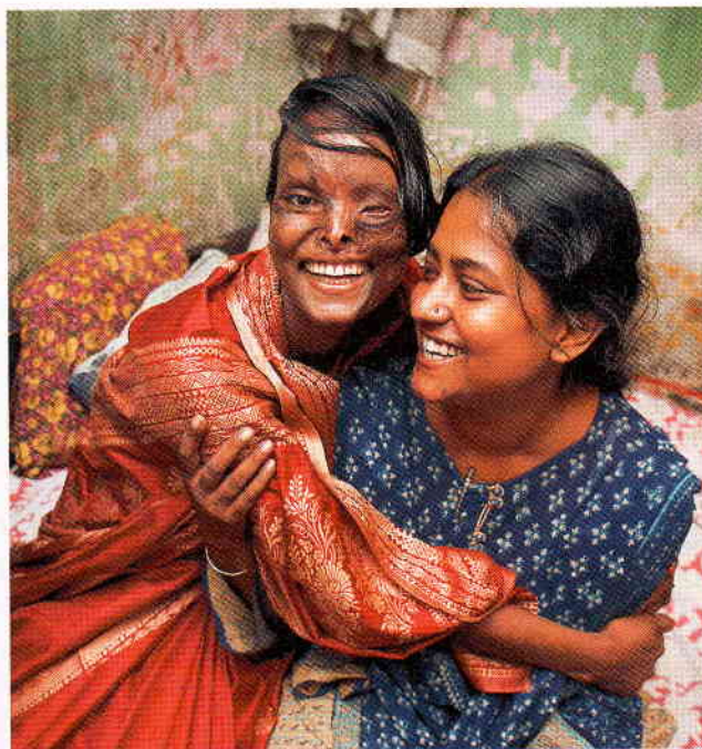
Ein 17-jähriges Opfer eines Säureattentates und ihre Freundin.

Ich weiß es nicht. Ich persönlich bin gegen die Todesstrafe. Die »Acid Survivors Foundation« bemüht sich gemeinsam mit anderen Menschenrechtsorganisationen, alternative Bestrafungen durchzusetzen. Zum Glück wurde bisher kein Säureattentäter hingerichtet. Die Todesstrafe trägt in keiner Weise zu einer Reduzierung der Verbrechen gegen Frauen bei. Dies gilt auch für Gefängnisstrafen, wenn die Täter nicht spe-