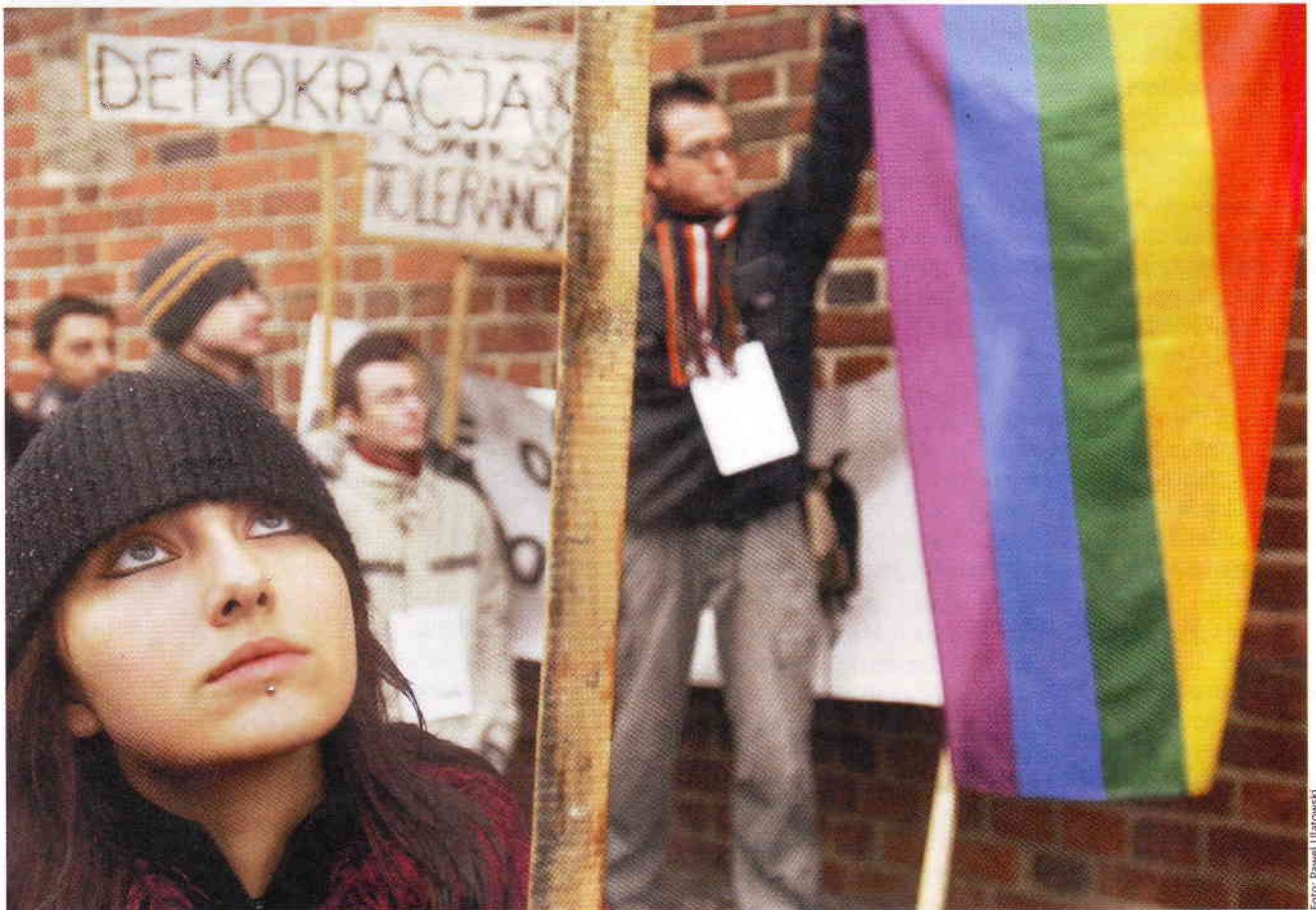
»Für Demokratie und Toleranz«. Transparente bei dem Marsch für Gleichheit in Krakau, 26. November 2005.