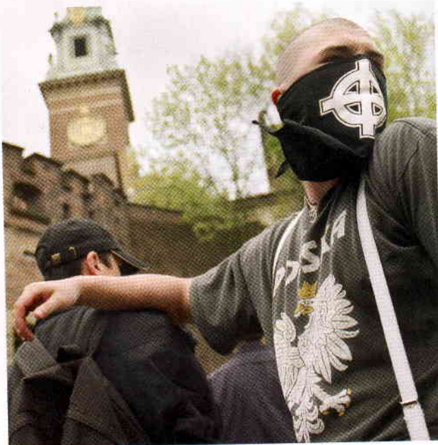
Mit Steinen und Flaschen. Gegner der »Parade für Gleichheit« in Krakau.

amnesty international beschäftigt sich seit einer Mandatserweiterung 1991 mit Menschenrechtsverletzungen an sexuellen Minderheiten und veröffentlicht seitdem regelmäßig Berichte. Die willkürliche Inhaftierung und Ermordung von Transsexuellen in Lateinamerika, die Verfolgung von Schwulen und Lesben in islamisch geprägten Staaten Asiens und Afrikas sowie die Diskriminierung von Menschen aufgrund ihrer sexuellen Identität in osteuropäischen Ländern standen in der Vergangenheit im Mittelpunkt der Arbeit von MERISI, der Sektionskoordinationsgruppe der deutschen Sektion von ai.